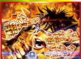
全画面原画セリフ予告