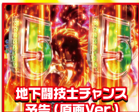
地下闘技士チャンス 予告(原画Ver.)